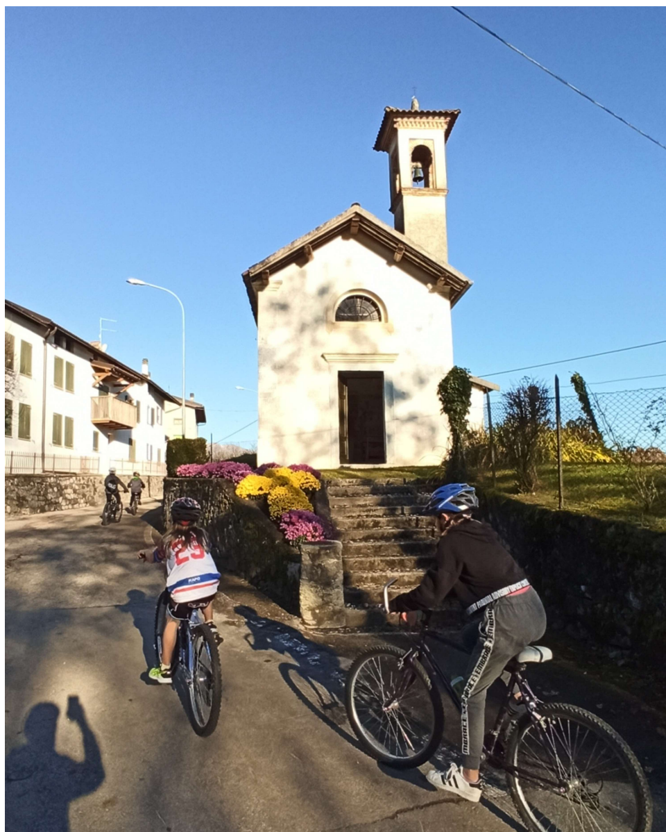
FOTO: Loc Colvago, la Chiesetta

la chiesa di S.Libera sulla dx, fino ad arrivare alla frazione di Salzan e al suo mulino [7]; risalire, attraverso un sottopassaggio ferroviario, in direzione nord per “via Piave” per circa 1km, fino a incontrare un piccolo parcheggio sulla sx, seguire il marciapiede ( scendere dalla bici ) sottopassando il ponte sulla Statale e giungere di nuovo in “piazza Maggiore”. Se si volesse percorrere una piacevole variante 400m prima della chiesa di S.Libera prendere sulla dx la strada “via Umasna”, sterrata, oltrepassare la chiesetta di San Pietro, seguire a sx “via Cal Sotta” che vi porterà in piazza a Salzan.