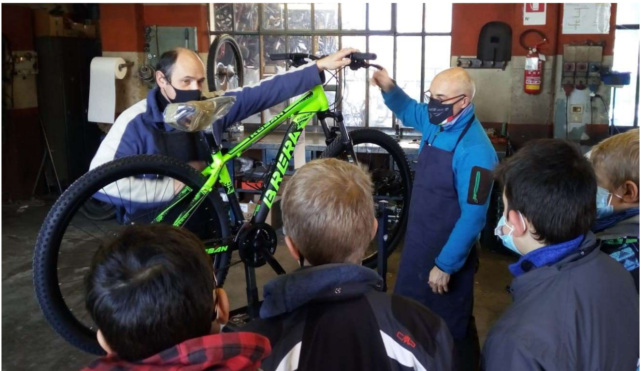
FOTO: Si ringraziano Gianni Girelli e Dario Danieli per la preziosa collaborazione tecnica fornita nello spiegarci le principali operazioni da fare per la manutenzione della bici