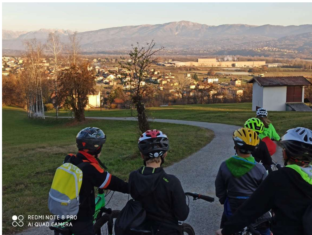
FOTO: Panorama sulla ValBelluna da loc Castel