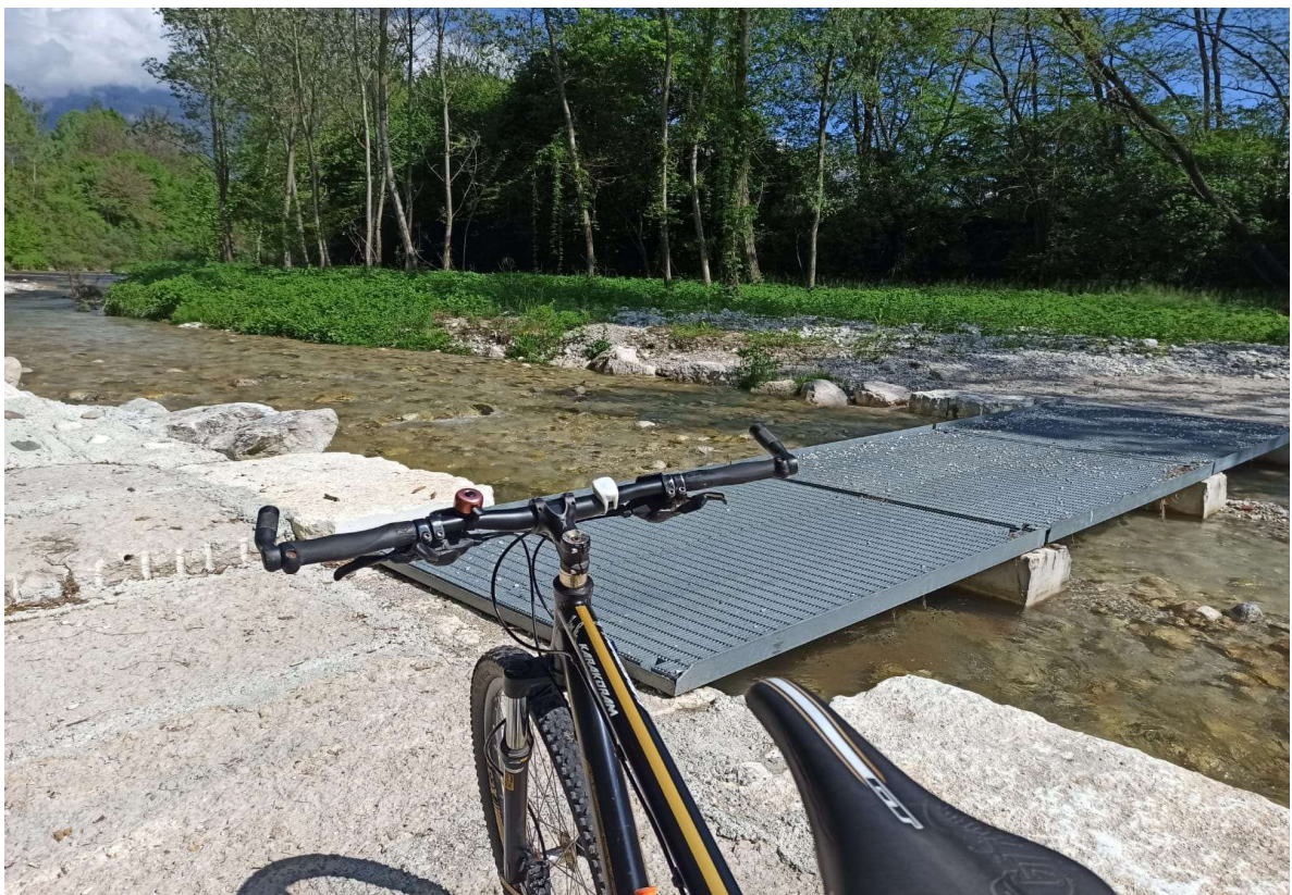
FOTO: Passerella sul Veses tra Carfai e Salzan