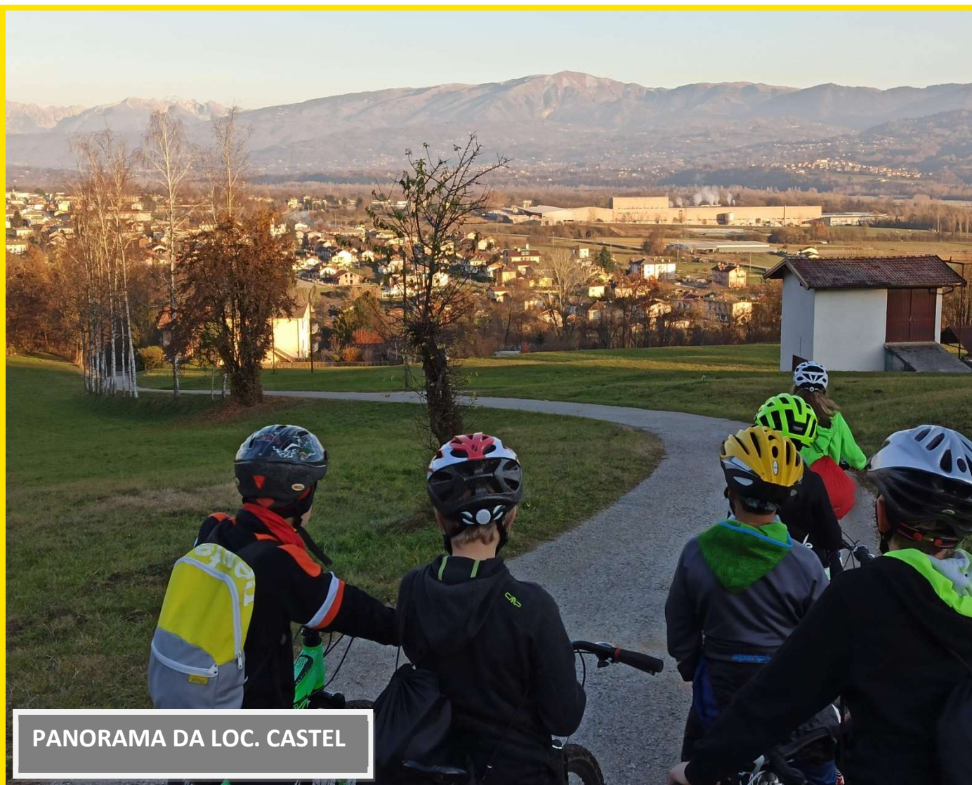
PANORAMA DA LOC. CASTEL

COLLANA A CURA DELL' ISTITUTO COMPRENSIVO " G. RODARI "